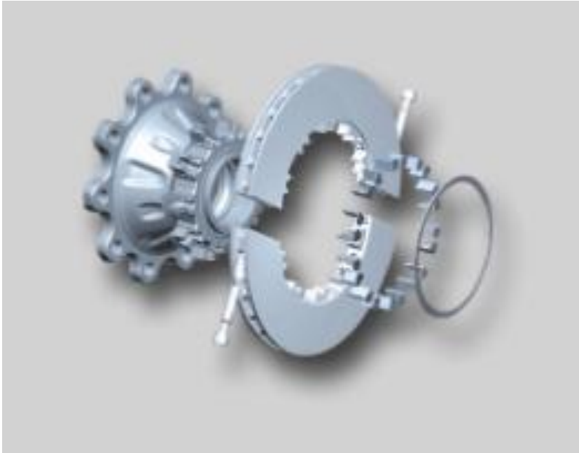
Диск Knorr VMZ